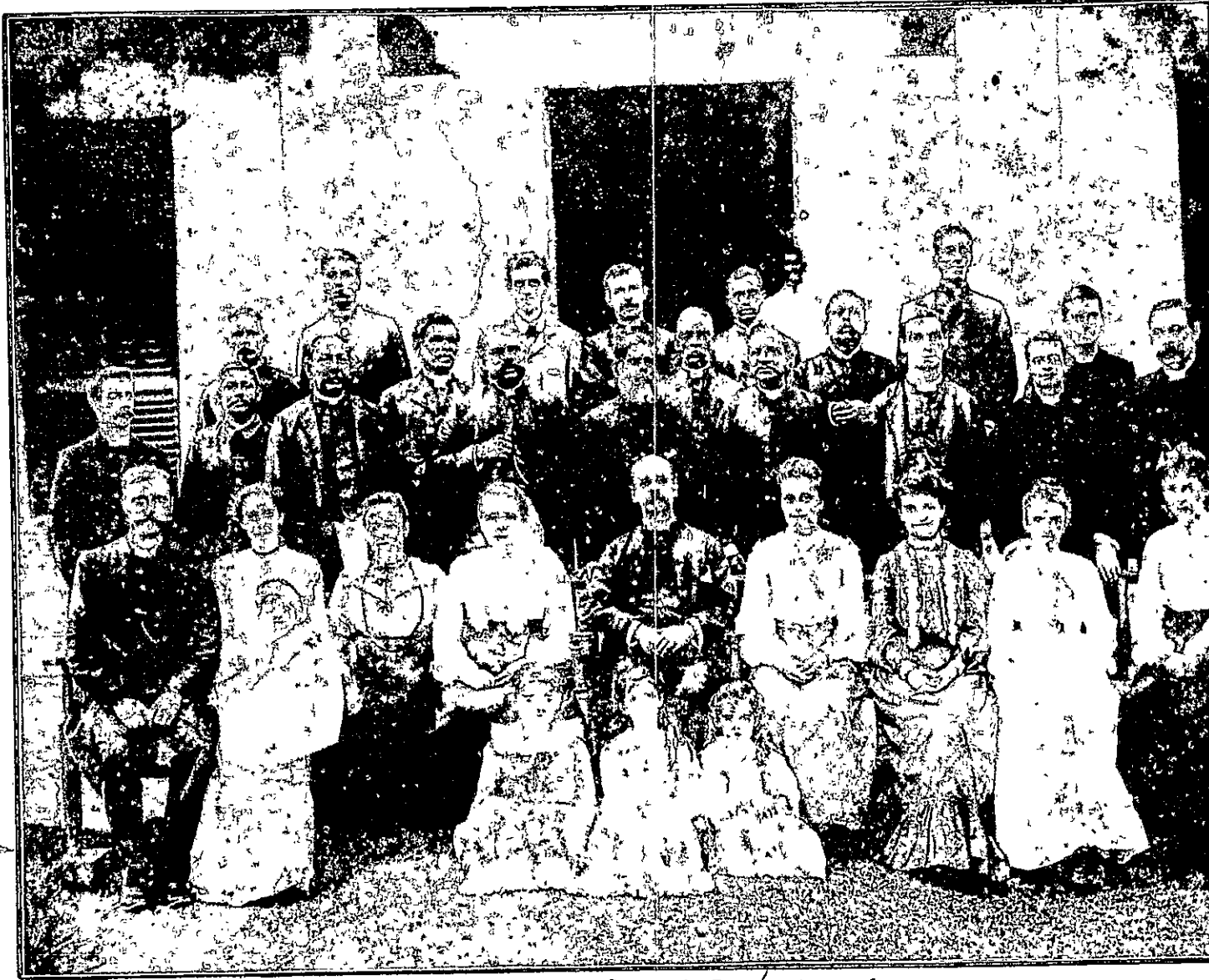
சில மிஷனரிமாருமும் போதகர்மாருமும்